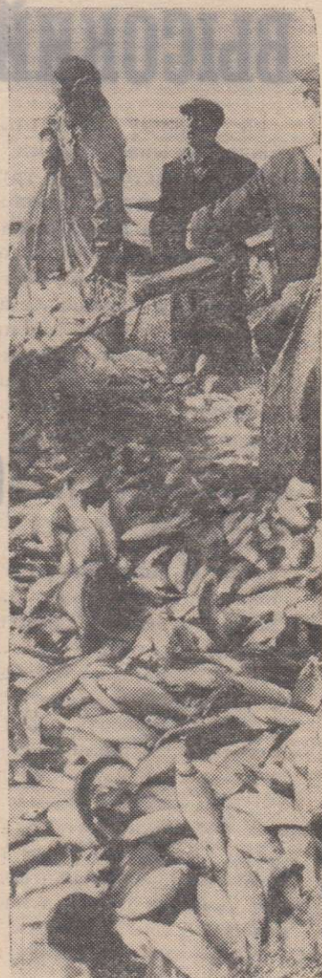
АСТРАХАНСКАЯ ОБЛАСТЬ. Полным ходом идет весенняя путина на Нижней Волге. Тысячи пудов рыбы ежедневно сдают рыбаки государству.